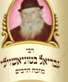
רבי גביאל טונוויטשיץ מופ"ד הרבנים