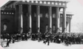
רחבת קתדרת וילנא, מקום בו הוציאו להורג

"שמע, זוהי הזדמנות אחרונה שלך! והיה, אם תעמד בגרף, תחפץ להשאר יהודי, ונתרו לך פחות מעשרים וארבע שעות לחיות קר. תבין שאלו שעותיה האחרונות עלי אדמות. אך את תסכים ותשמע, ותסכים לחוד לדת הנצרות תשתחרר מיד ותוכל לחיות בעשר ואשר כל ימך". "חל לבו! נוף בו גר הצדק. "כל העניינים שעיני את גופי עד תהא פאעל, כך גם דבריך בעת, לא יועילו מאומה. יהודי אנכי וכיהודי אמות. תן לי לנצל את השעות שנתרו לי להדבק בתורתך ובאמונתך".