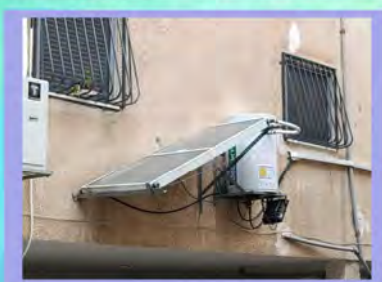
כשהמתקין מתעצל לעלות לגג

כשהייתי קטן לא היה אכפת לי מה אני לובש, כשאני מסתכל בתמונות שלי, אני רואה שגם להורי לא היה אכפת.