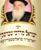
רבי שמואל מרדכי טומסקי ראב"ד פריס